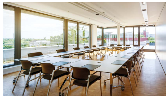
Tagungsraum Yellow, Green und Blue (flexibel kombinierbar)